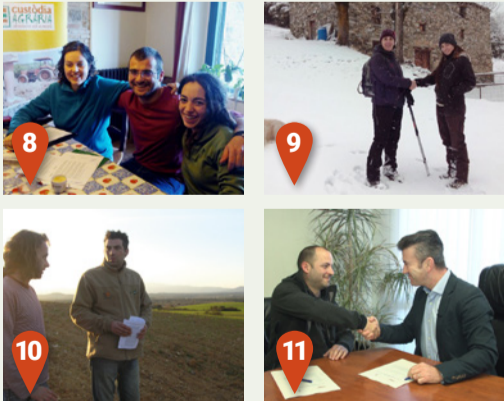
Nous acords signats el 2015