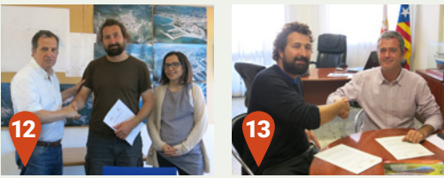
Nous acords signats el 2016